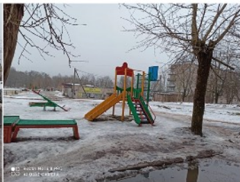
● 03 РЕКВИЗИТЫ В ПЛО 002 А1 00427 САНКТ-ПЕТЕРБУРГ