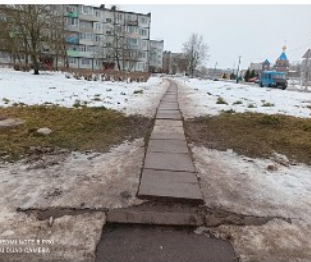
● 01 РЕКВИЗИТЫ В ПЛО 002 А1 00427 САНКТ-ПЕТЕРБУРГ