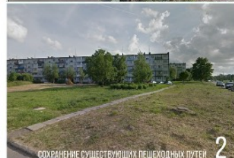
СОХРАНЕНИЕ СУЩЕСТВУЮЩИХ ПЕШЕХОДНЫХ ПУТЕЙ