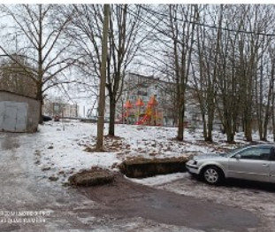
● 04 РЕКВИЗИТЫ В ПЛО 002 А1 00427 САНКТ-ПЕТЕРБУРГ