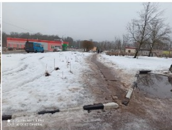
● 02 РЕКВИЗИТЫ В ПЛО 002 А1 00427 САНКТ-ПЕТЕРБУРГ