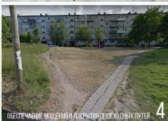
ОБЕСПЕЧЕНИЕ МОЩЕНИЯ И ПОКРЫТИЯ ПЕШЕХОДНЫХ ПУТЕЙ