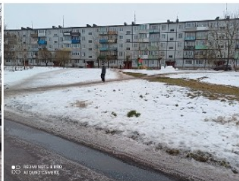
● 05 РЕКВИЗИТЫ В ПЛО 002 А1 00427 САНКТ-ПЕТЕРБУРГ