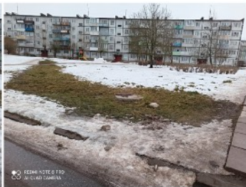
● 06 РЕКВИЗИТЫ В ПЛО 002 А1 00427 САНКТ-ПЕТЕРБУРГ

ЛЕНИНГРАДСКАЯ ОБЛАСТЬ, ЛОМОНОСОВСКИЙ РАЙОН, Д.ОРЖИЦЫ