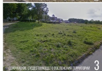
СОХРАНЕНИЕ СУЩЕСТВУЮЩЕГО ОЗЕЛЕНЕНИЯ ТЕРРИТОРИИ