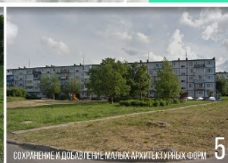
СОХРАНЕНИЕ И ДОБАВЛЕНИЕ МАЛЫХ АРХИТЕКТУРНЫХ ФОРМ